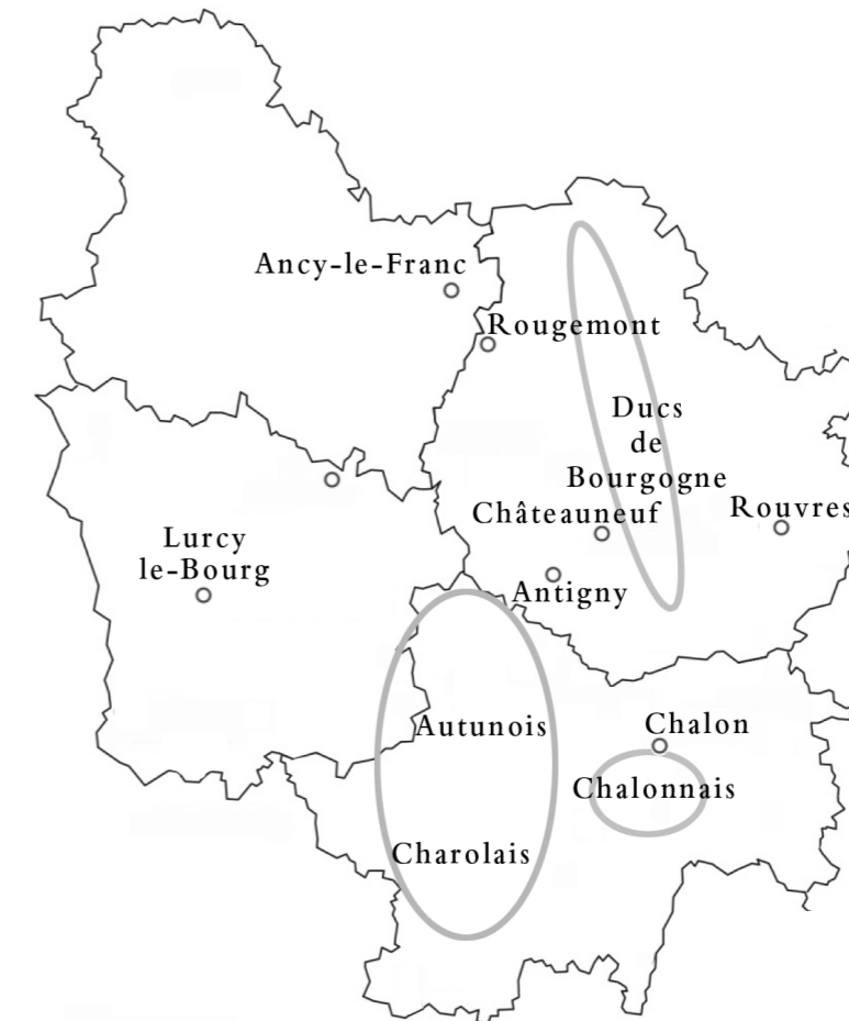
Répartition géographique des études